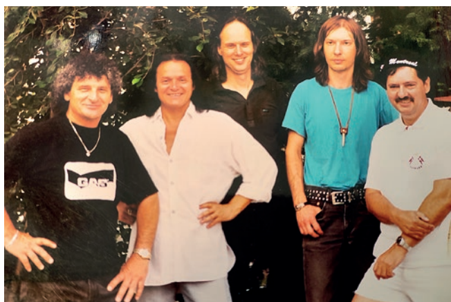
A Pardon, a legendás Tunyogi Péterrel

Végre aztán elhatároztuk, hogy újra, immár hivatalos formában is megjelentetjük ezt az albumot, hogy Tunyó utolsó munkáját a szélesebb rétegek is megismerjék. Ez a lemez egy igazi rocktörténeti érdekesség és érték, amely méltó emléket állított Tunyogi Péternek.