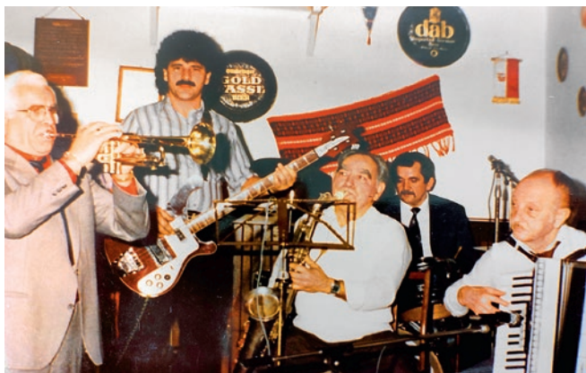
A nagy öregekkel, Húber Lőrinc legendás zenekarával

rom másodállást is, két helyen voltam üzletkötő és egy magánvállalkozásba is belekezdtem. Vettem 10 golyóscsapot, melyeket aztán értékesítettem, és abból a pénzből már 20, majd 30-40 darabot vásároltam.