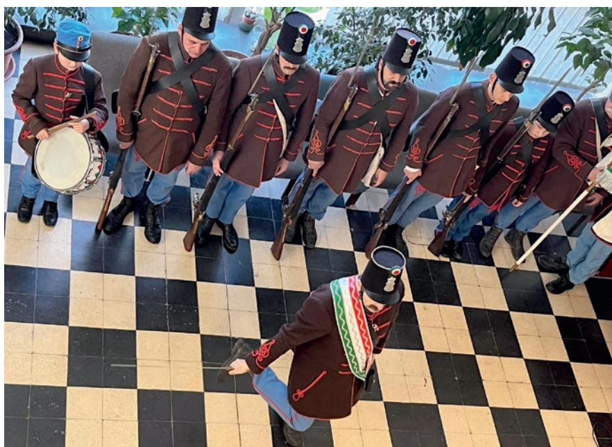
A Budakeszi Katonai Hagományörző Egyesület honvédei is megtisztelték ünnep-ségünket, s toborzó táncukat bemutatva adtak egy kis ízelítőt tevékenységükről

A diáknapok lezárását a szintén hagyományos tanár–diák focimeccs jelentette. Jó volt együtt játszani, vetélkedni, kiszakadni a megszokott keretektől. Köszönjük a szervező tanárok és diákok munkáját.