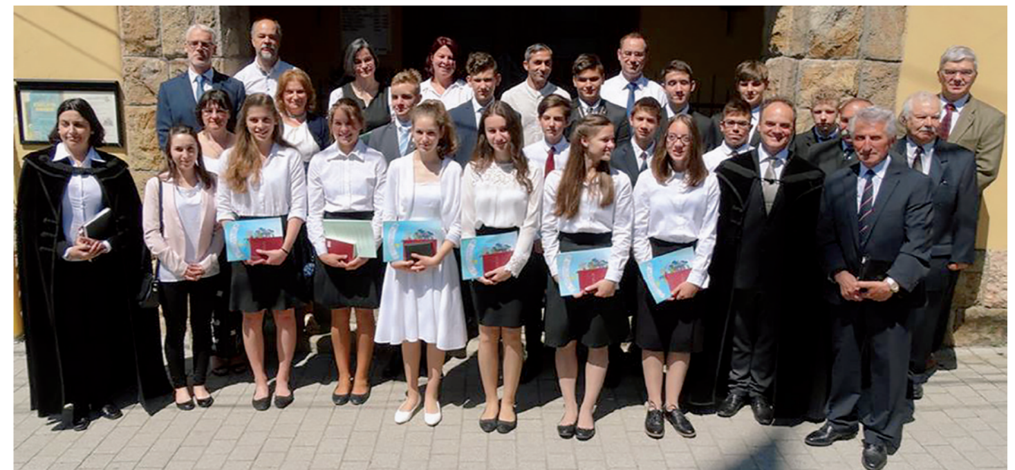
Konfirmandusok presbiterekkel 2018. pünkösdjén

a Budakeszi Hagyományörző Kör kórusvezető