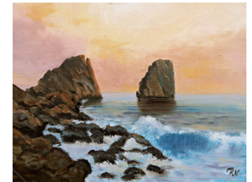
Riedl Nóra – Tengeri fény (olaj, 2017)

A tanács a továbbiakban is aktívan szeretne részt vállalni városunk közéletében, legközelebbi nagyobb megmozdulásunk is ezt vetíti előre. Az Európai Unió által támogatott BeVonzó