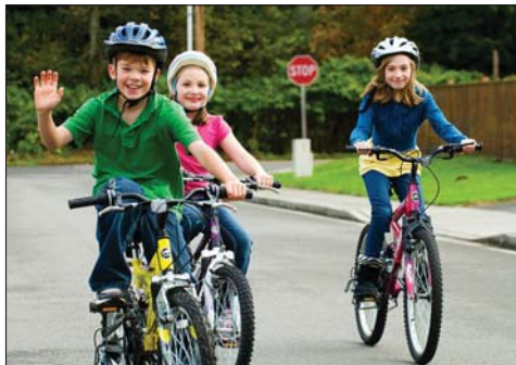
Kerüld ki a reggeli dugót bicikkel! (www.ptotoday.com)

Ha bútorra (írásztal, szék), biciklire vagy egyéb, másodkézből is beszerezhető termékre van szükségünk (például: alig használt iskolatáska), nézzünk szét valamelyik internetes piactéren vagy adományboltban.