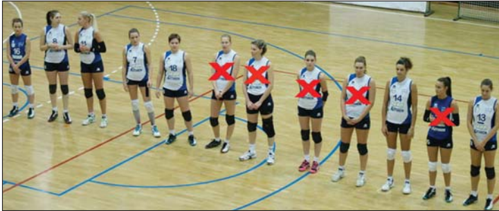
Az x-szel jelölt játékosok távoztak Gödöllőről

A gödöllői női röplabdasport élvonalbeli története 2000 óta bővül újabb és újabb fejezetekkel. Szeptember 27-én a 15. első osztályú (extraliga, NB I.) bajnoki évadjának vág neki a helyi hatos, amely fennállása során eddig három ezüst- (2007, 2012, valamint 2013) és két bronzérmét (2010, illetve 2014) nyert a honi pontvadászatban. Az arany tehát hiányzik a gödöllői lányok tarsolyából. Igaz ez a Magyar Kupa-szerelésre is, ahol egyaránt három-három ezüst (2011, 2013, 2014) és bronz (2007, 2009, 2012) városunk csapatának medália-mérlege.