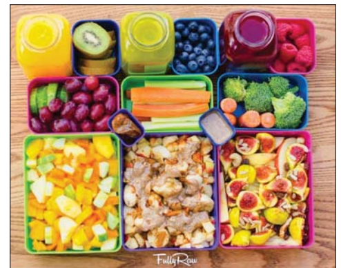
Nyers falatok tízóiraia

Mit csomagoljunk? Egészséges, szezonális, lehetőleg helyben termelt alapanyagokból készítsük a szendvicset/falatozót. A gyerekeket vonjuk be a hozzávalók kiválasztásába, így valószínűbb, hogy meg is eszik, amit kapnak. Ne csipsz és muffin legyen a tízórai: a gyümölcsök nem csak egészségesebbek, de a csomagolásuk is lebomlik.