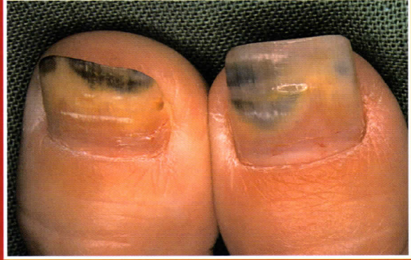
10. ábra: Pseudomonas baktérium okozta elszíneződés