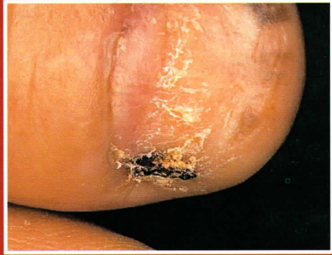
12. ábra: Subunguális melanoma malignum