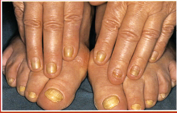
11. ábra: Sárgaköröm syndroma