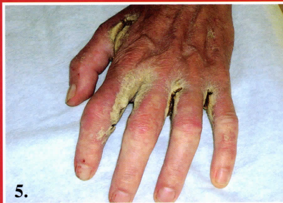
5. ábra: Hyperkeratosis és rhagasok interdigitalisan a kézen