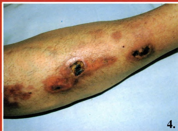
4. ábra: Fájdalmas, exulcerálódott plakkok