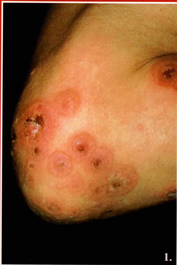
1. ábra: A könyöktájékon circiner erythemás plakkok, centrálisan bullák, erosiók