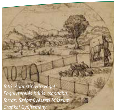
fotó: Augustin Hirschvogel: Fogolyterelés hálós csapdába