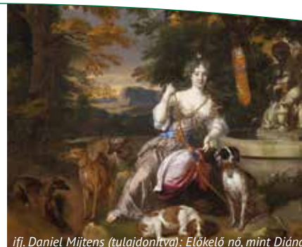
ifj. Daniel Mijtens (tulajdonitva): Előkelő nő, mint Diána