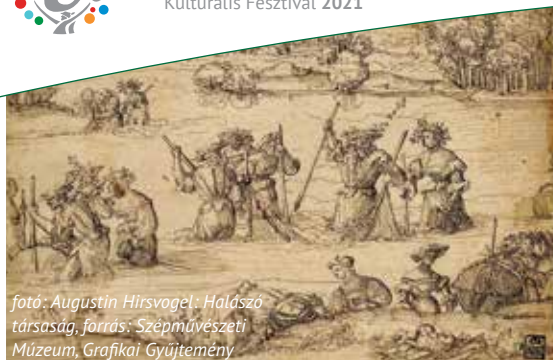
fotó: Augustin Hirschvogel: Halászó társaság, forrás: Szépművészeti Múzeum, Grafikai Gyűjtemény