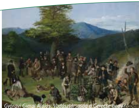
Györgyi Giergl Alajos: Vadásztársaság a Gerecse hegységben