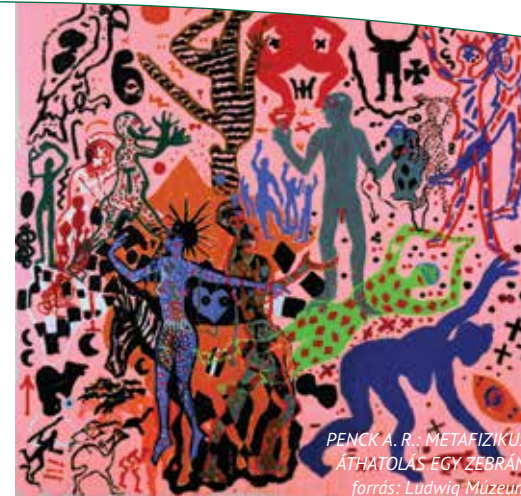
PENCK A. R.: METAFIZIKUS ÁTHATOLÁS EGY ZEBRÁN, forrás: Ludwig Múzeum