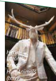
Hervé- Lóránth Ervin HumAnimals (terv)