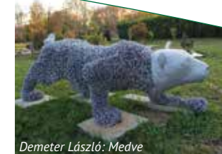
Demeter László: Medve