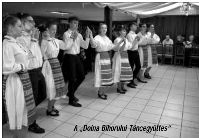
A „Doina Bihorului Táncegyüttes”