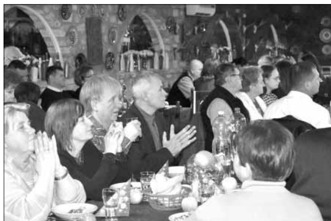
A sarkadi román közösség tagjainak egy csoportja