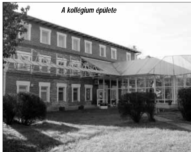
A kollégium épülete

Az intézményről az érdeklődők sok információt szerezhetnek a gimnázium honlapján, www.adybay.hu és a Facebook oldalán, https://www.facebook.com/adybaygimi . A Gimnázium telefonszáma: 66/375-155.