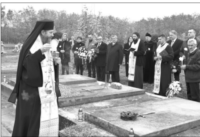
A román nyelvű ortodox és a magyar nyelvű református szertartás

A főkonzul a megbeszélésen kihangsúlyozta, számára örömteli az a tény, hogy a sarkadi városvezetés jó partnereinek tekinti a városban