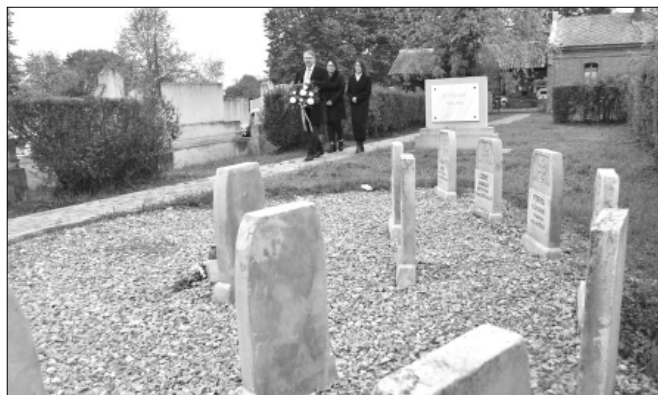
A város vezetése a magyar katonasíroknál a Körösháti temetőben