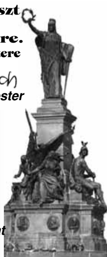
(Az aradi Szabadság szobra)