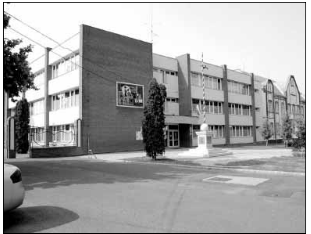
A projektben szereplő épületek (a képen a Kossuth utcai Általános Iskola) a város esztétikai képét is felpozícionálják, elevenebbé varázsolják

A megújuló energiahasználati projekt rész az öt épület – fabrikett tüzelésű kazánok beépítésével történő – biomassza alapú hőellátásának, valamint há-