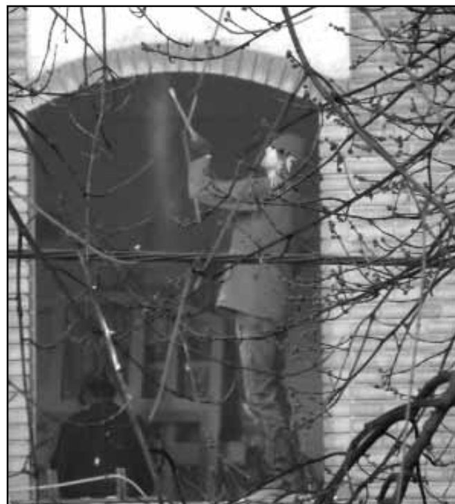
Az általános iskola patinás épülete is új ablakokat kapott