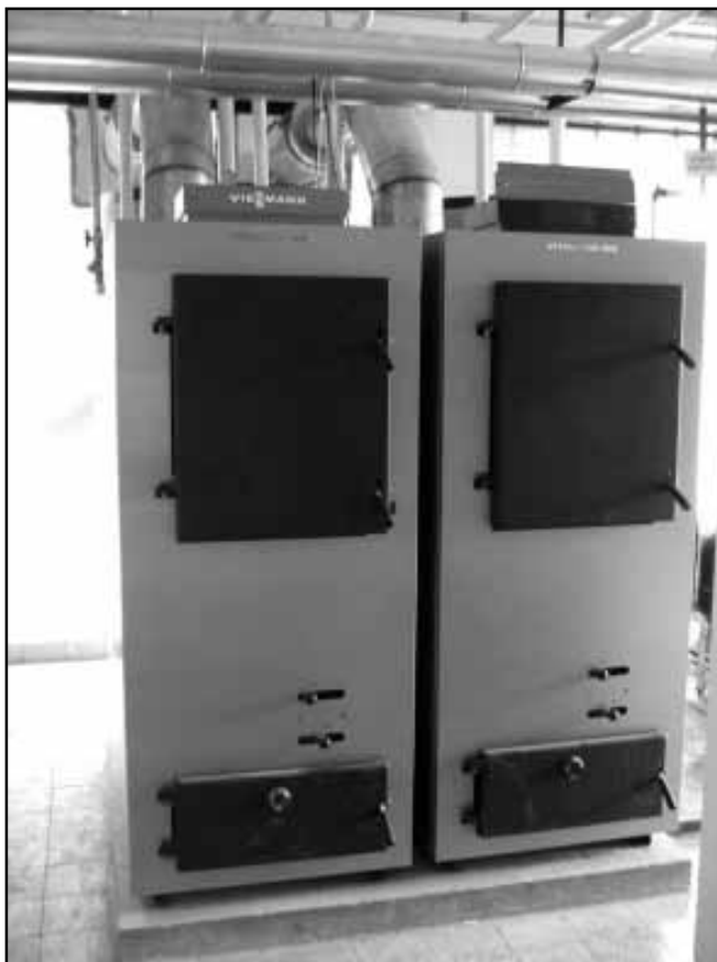
A fabrikett tüzelésű kazánok