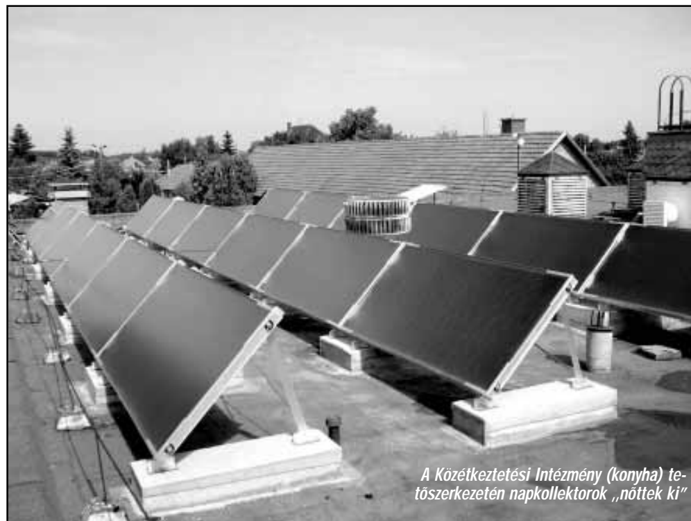
A Közétközvetési Intézmény (konyha) tetőszerkezetén napkollektorok „nőttek ki”