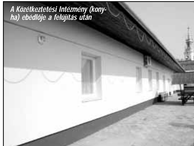
A Közétközvetési Intézmény (konyha) ebédlője a felújítás után