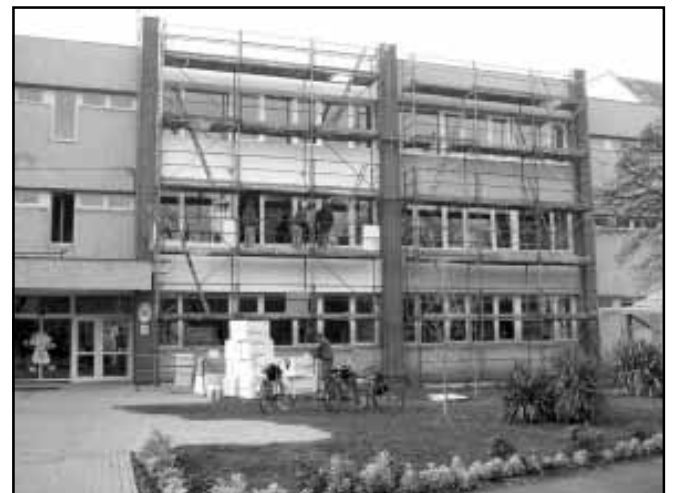
A régiüket új, korszerű, műanyag szerkezetű nyílászárókra cserélték

A projekt alapját képező pályázat a Környezet és Energia Operatív Program