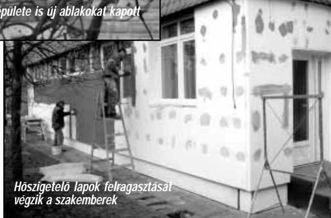
Hőszigetelő lapok felragasztását végzik a szakemberek