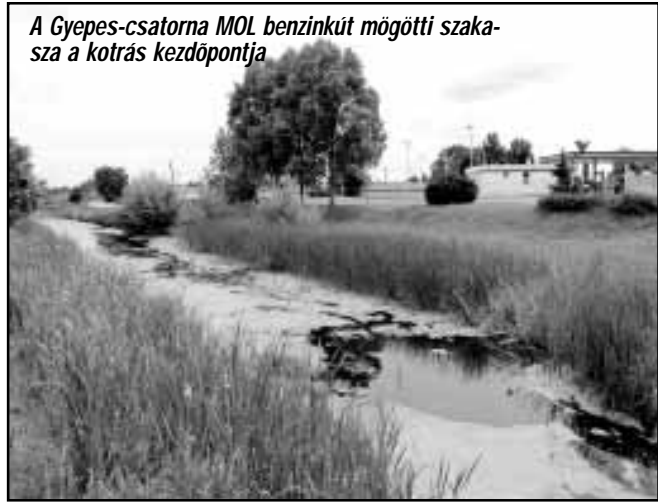
A Gyepes-csatorna MOL benzinkút mögötti szakasza a kotrás kezdőpontja

Projekt címe: WaterMan2 - Hatékony csapadékvíz-elvezetőrendszer kiépítése Nagyszalonta-Sarkad határon átnyúló régióban - I. ütem Projekt azonosítója: HURO/1101/030/1.3.2 Vezető Partner: Nagyszalonta Megyei Jogú Város Önkormányzata Projekt Partner: Sarkad Város Önkormányzata Projekt megvalósítás időtartama: 2012.12.01. - 2014.11.30.