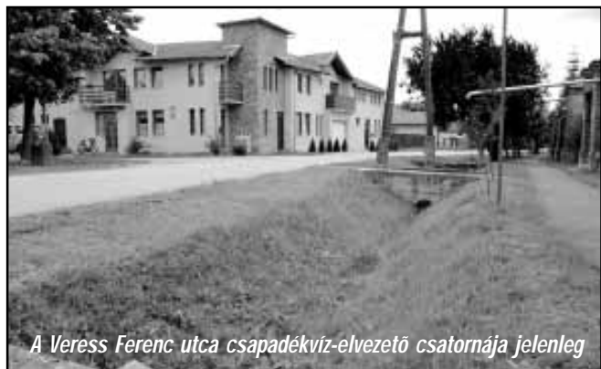
A Veress Ferenc utca csapadékvíz-elvezető csatornája jelenleg