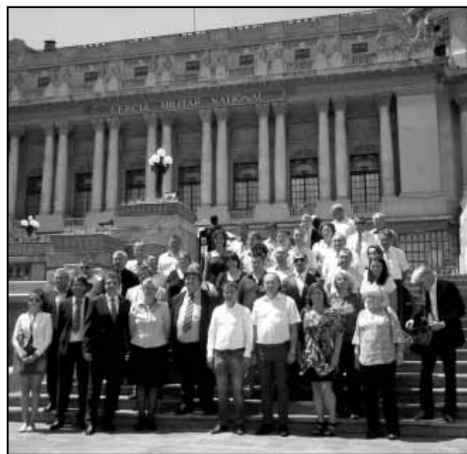
A delegáció a Bukaresti Nemzeti Katonai Kör Palotájának lépcsőjén

Útban hazafele a delegáció az egykori Miklósvár fiúszék, ma Erdővidék központjának számító háromszéki testvértelepülésen, Baróton is megmártóztott a Barót Napok rendezvénysoro-