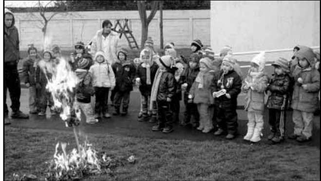
Téltemető: bábégetés az óvoda udvarán