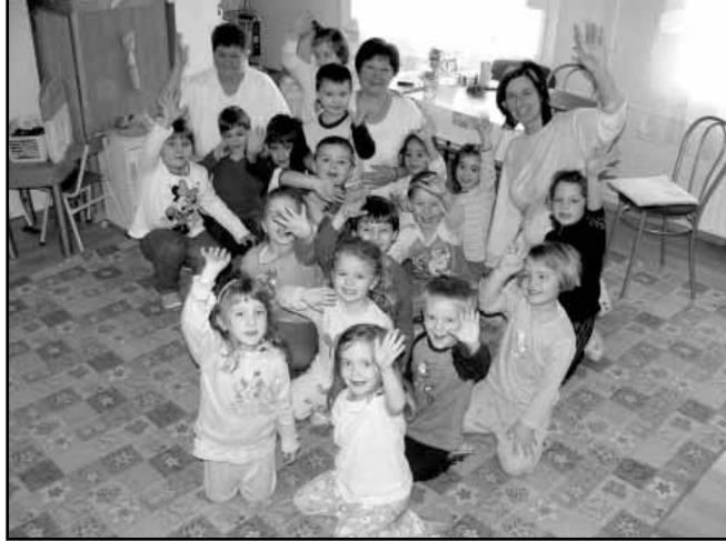
A hét első napján pizsamába bújtak a gyerekek

„Vízkeresztől negyven napig mulatoznánk pirkadatig. Farsang faggylal érkezett, táncal temettük a telet. Nagybőjt előtt farsang farka, hacacaré már öt napja. Véget ér a karnevál, jövőre majd újra vár.”