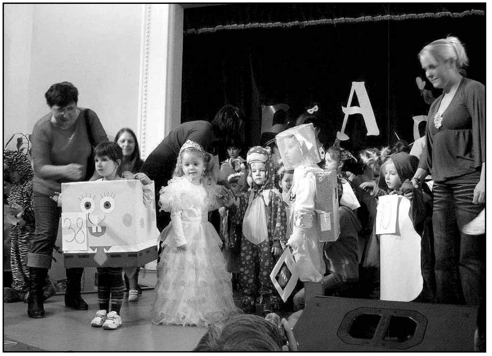
Jelmezesek felvonulása: 59 gyermeket öltöztettek szülei jelmezbe az idei farsangra

vendégek és gyerekek kelleme délelőttel lettek gazdagabbak.