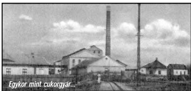
Egykor mint cukorgyár...