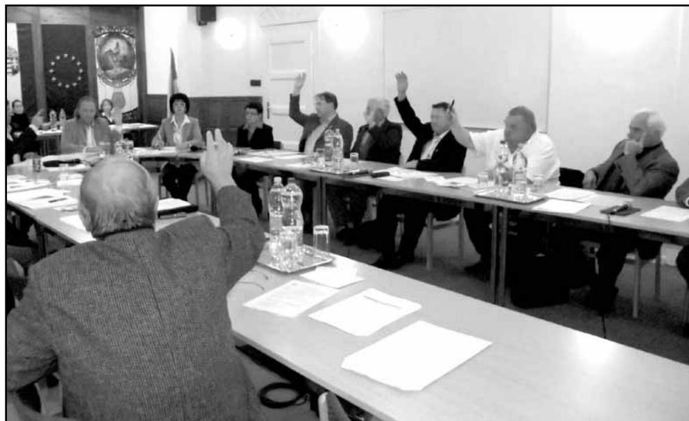
A képviselők felemelt kézzel jelzik egyetértésüket, szavazással zárják le a napirendi pontot

Az ötödik napirendi pontban egy sor önkormányzati rendelet módosítása következett. Előbb az állatok tartásáról szóló helyi rendeletet helyezte hatályon kívül a testület, illetve az egyes tiltott, kirívóan közösségellenes magatartásokról szóló önkormányzati rendeletet módosította, majd módosításra került a felsőoktatási tanulmányokat folytató fiatalok ösztöndíj támogatásáról szóló önkor-