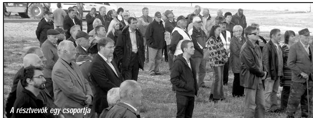
A résztvevők egy csoportja

polgármester köszönetet mondott mindazoknak, akik segítettek a rendezvény lebonyolításában és külön megköszönte a kaposvári Magyar Cukor Zrt. támogatását,