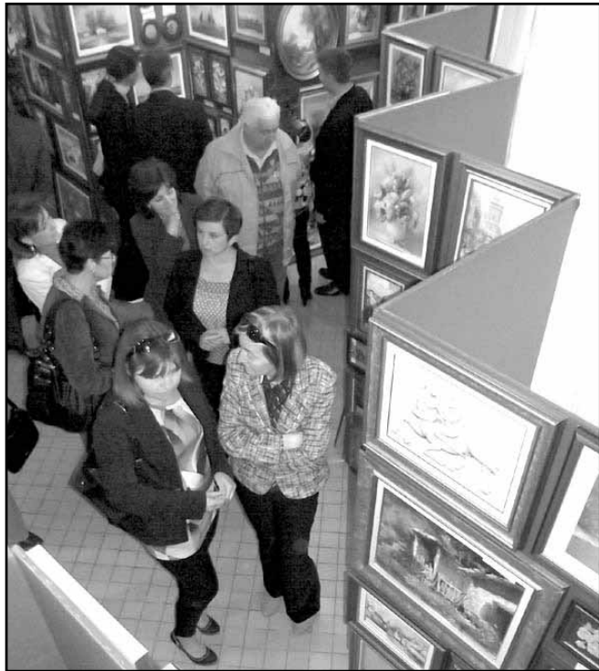
„Rengeteg” látnivaló volt a parvánokon

A műalkotások jelentős része olajfestmény, melyek mellett akril festmények, pasztell képek, grafikák, valamint tűzzománcok és borszobrok is láthatók a galéria bemutatóin, kiállításain, így Sarkadon is.