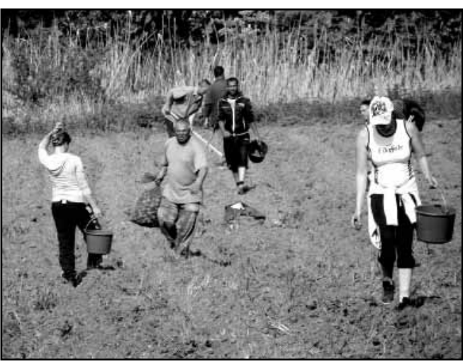
A burgonya vetése

Az állami tulajdonú termőföldek megpályázása kapcsán azonban problémák is felmerültek, ugyanis az önkormányzat által megpályázott és megnyert állami földterületeket korábban sarkadi gazdák bérelték és folytattak ott termelő tevékenységet. A problémát alapvetően az generálta, hogy az említett gazdák annak ellenére végeztek különböző munkákat és eszközöket befektetéseket az önkormányzat által törvényesen megpályázott, majd elnyert állami földterületeken, hogy tudták, le fognak járni az adott terület művelésére korábban megkötött szerződéseik. Ehhez azonban azt is hozzá kell tenni, hogy a gazdák a Nemzeti Földalapkezelőtől félreérthető információkat kaptak, és arra számítottak, hogy szerződéseiket megújítják. Sajnos ennek mentén igen kel-