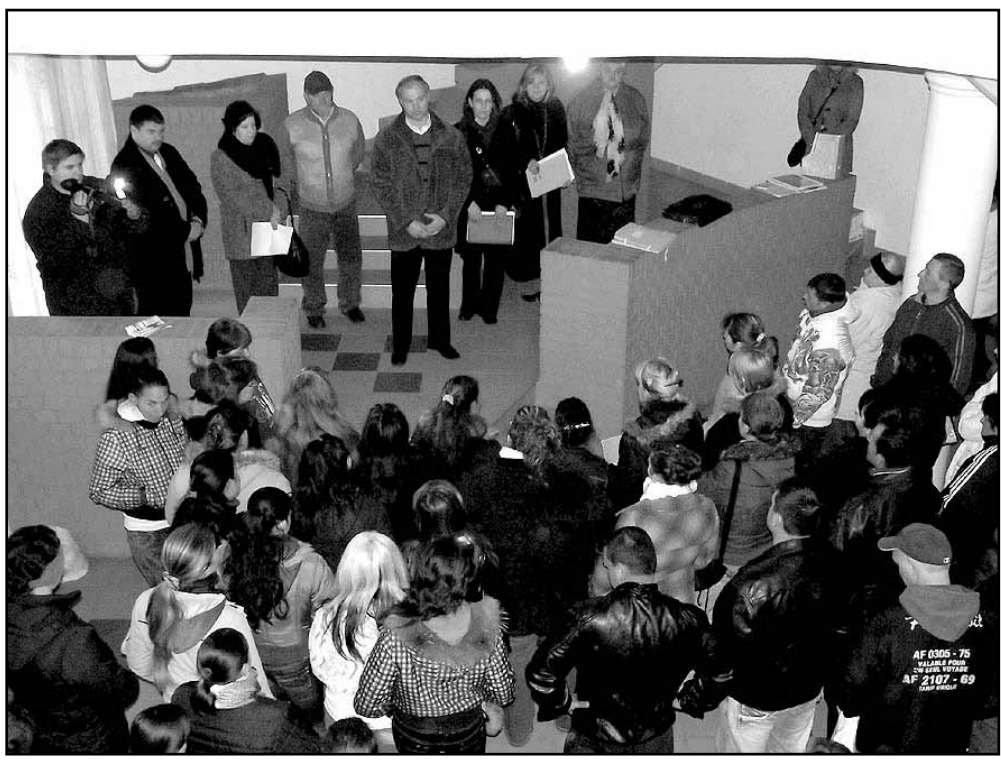
Márciusi tanévnyitó: minden héten, szombaton iskolai oktatásra is sor kerül, melyben a program résztvevői elsajátíthatják a szántóföldi zöldségtermesztés elméleti és gyakorlati ismereteit.

Sarkad Város Önkormányzata egy nyertes pályázatnak köszönhetően már az idei év elején elindította a „ Start Munka Mintaprogram ”, melynek keretében megvalósul egy mezőgazdasági jellegű projektrész, sor kerül a belterületi önkormányzati tulajdonú utak kátyúzására, illetve a külterületi esővíz elvezető csatornahálózat takarítására is.