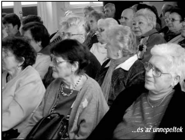
...és az ünnepeltek