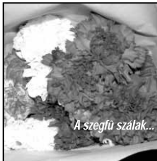
A szegfű szálak...