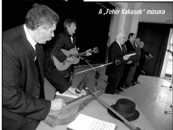
A „Fehér Kakasok” műsora