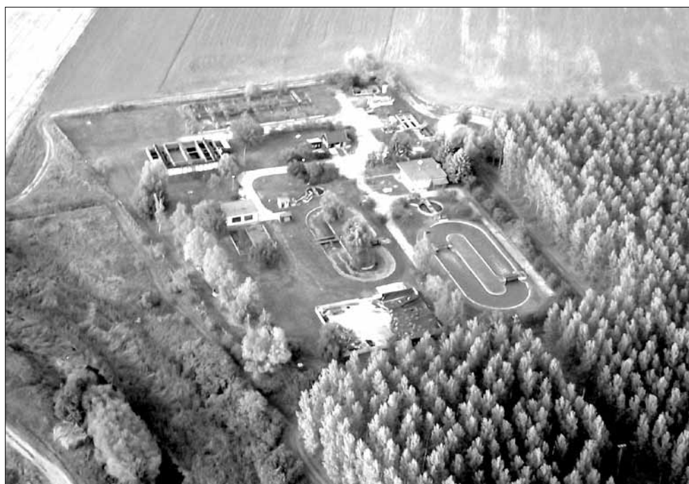
A sarkadi szennyvíztisztító a város „használt” vizének a végállomása, innen tisztán kerül vissza a talajba

Továbbá feltétlenül meg kell jegyezni, hogy Magyarországon már 1847-ben felismerték a csatornázás szükségességét és megalkották az első csatornázási sza-