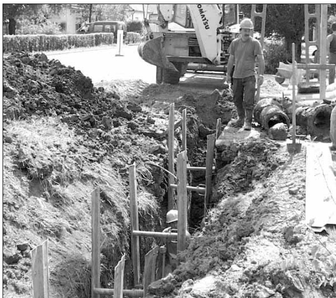
A szennyvízcsatorna-hálózat építése ebben az évben folytatódik