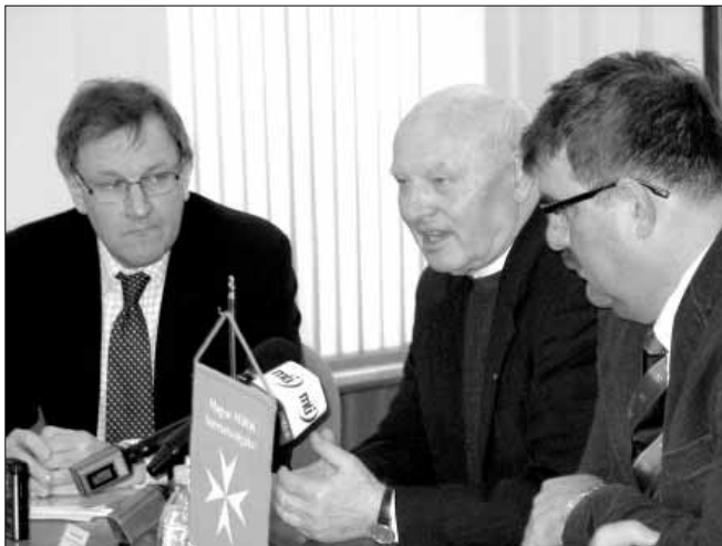
A két szervezet vezetői

Polgármesteri Hivatal Népjelölti Osztály