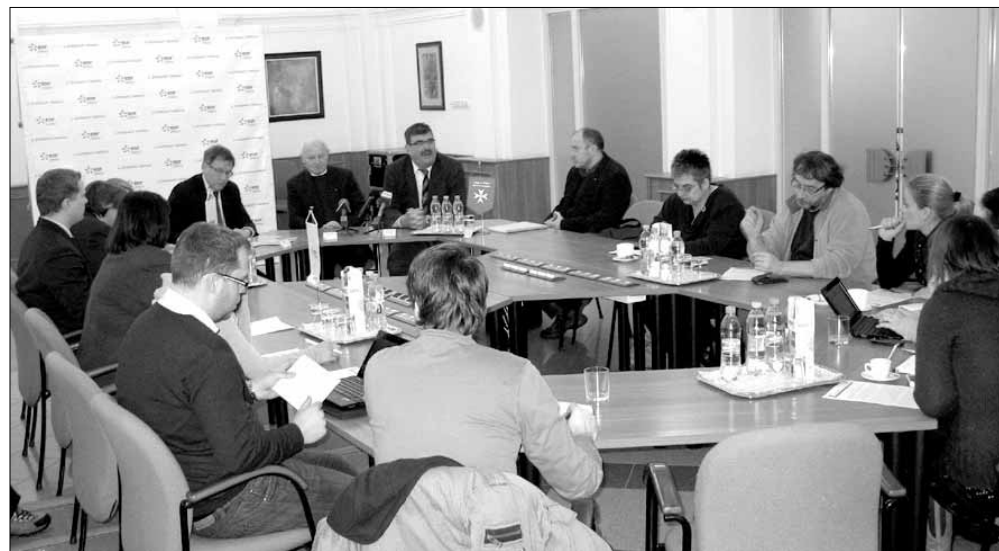
Az EDF DÉMÁSZ Zrt. és a Magyar Máltai Szeretetszolgálat közös sajtótájékoztatót jelentette be a program indítását