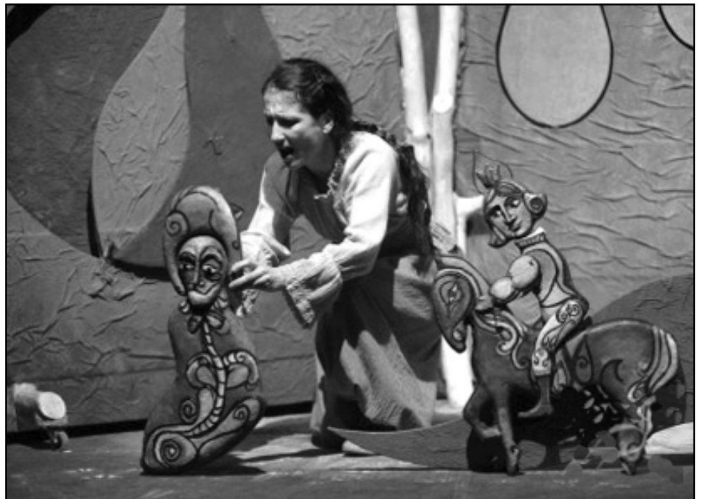
Pályázható a Békés Megyei Napsugár Bábszínház vendégszereplése is

A Békés Megyei Önkormányzat pályázatot hirdet a Békés megyei kulturális élet élénkítésére, az egészségmegőrzés, egészséges életmód szemléletének erősítésére, a megyei kiemelt rendezvények támogatására, a megyei turizmus erősítésére.