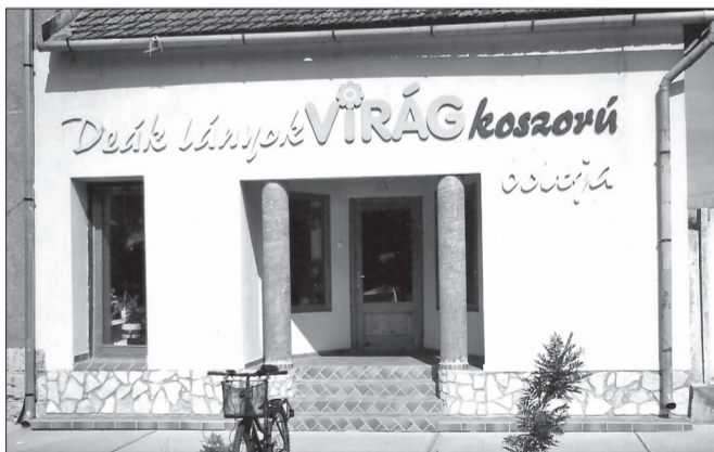
Színezett homlokzat, terméskő lábazzal, a bejárat előtt „hal-szálka” irányban lerakott burkolat a Szent István téren