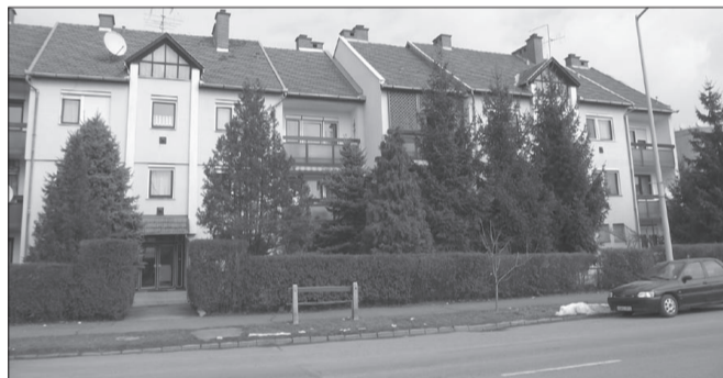
26 lakásos társasház homlokzati felújítása Baumit nemesvaklattal (Árpád fejedelem tér)