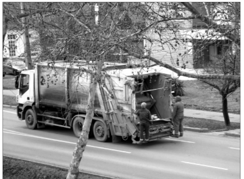
A Békés-Manifest Kht. hulladékgyűjtő járműve a Kossuth utcán