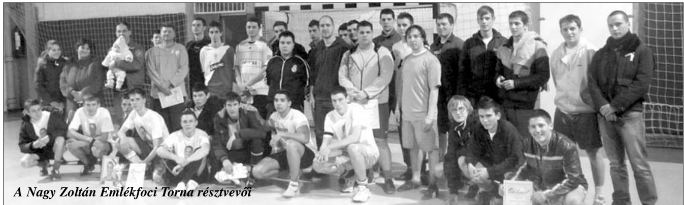
A Nagy Zoltán Emlékfoci Torna résztvevői