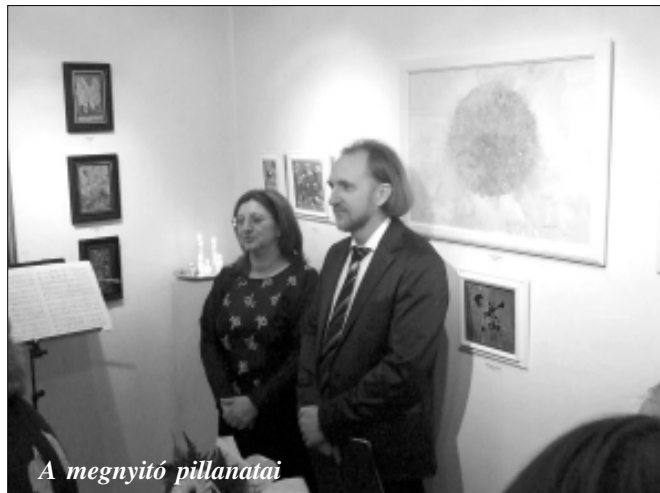
A megnyitó pillanatai