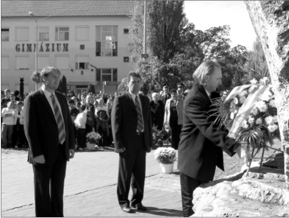
Elsőként a város vezetése helyezte el emlékező koszorúját a Vértanúk terén