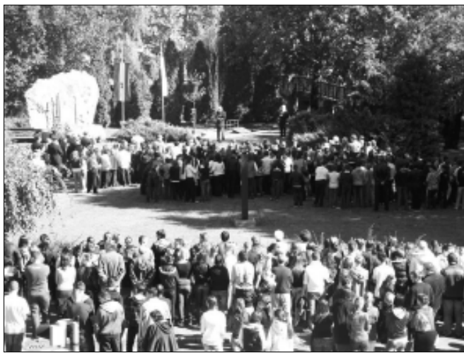
A Vértanúk tere 2010. október 6-án

Nagy-Sándor József: sztoikus nyugalommal tűrte a halált, s ezt mondta a hóhérnak: Hodie mihi, cras tibi. De előtte még megállapította: „de