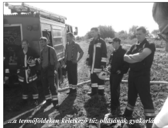
...a termőföldeken keletkező tűz oltásának gyakorlása