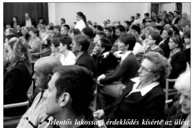
Jelentős lakossági érdeklődés kísérte az ülést

A polgármesteri programot követően gördülékenyen, jó hangulatban zajlott az alakuló ülés, amit alapvetően az együttműködés, az emberi-