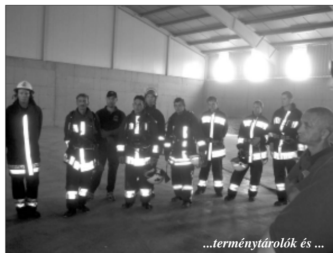
...terménytárolók és ...

Ezt követően az aradi vértanúk emlékművénél a város vezetése és valamennyi állami, társadalmi szervezet elhelyezte az emlékező virágait. Az ünnepség a Szózat hamgjaival zárult. -kas