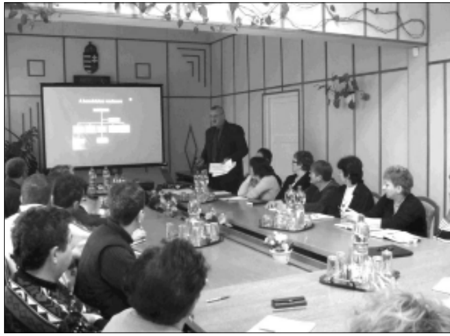
Kistelepülési gyakorlat elméleti oktatása Sarkadkeresztúron

rek gyors fejlődése következményeként a megnövekedett követelmények és feladatok szükségessé tették, hogy létrejöhessen az ország egészét átfogó védelmi rendszer, amely – a mindenkori legfontosabb feladat – a lakosság védelme érdekében mozgósítani tudja a rendelkezésre álló erőket, eszközöket.