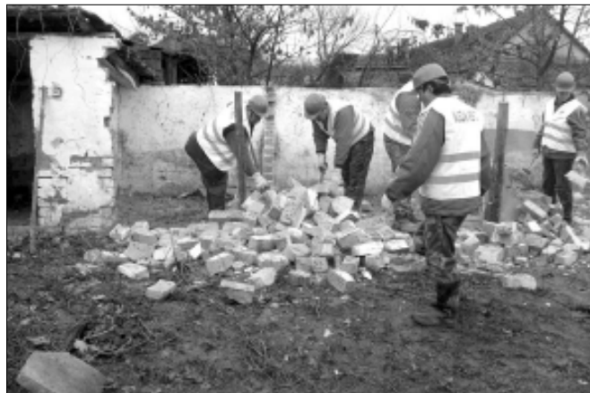
Kistelepülési gyakorlat Sarkadkeresztúron

2010. február 09-én a 3. sz. Napközi Otthonos Óvoda középső és nagycsoportos korú gyermekei a békéscsabai Napsugár Bábszínház előadásán vehettek részt. A bábszínház pályázaton nyerte el a gyermekek utaztatásához szükséges pénzüsszeget így gyermekeink útiköltség térítés nélkül tekinthették meg a bábszínház előadását. A Világszép Nászalkisasszony című mese elvarázsolta a gyermekeket és az őket kísérő felnőtteket egyaránt. Egy csodálatosan kivitelezett és előadott produkciót láthatott a kis közönség.