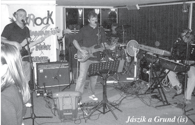
Jászik a Grund (is)

Ezen alkalmából 2009. február 6-án este 9-től születési bulit rendezünk.