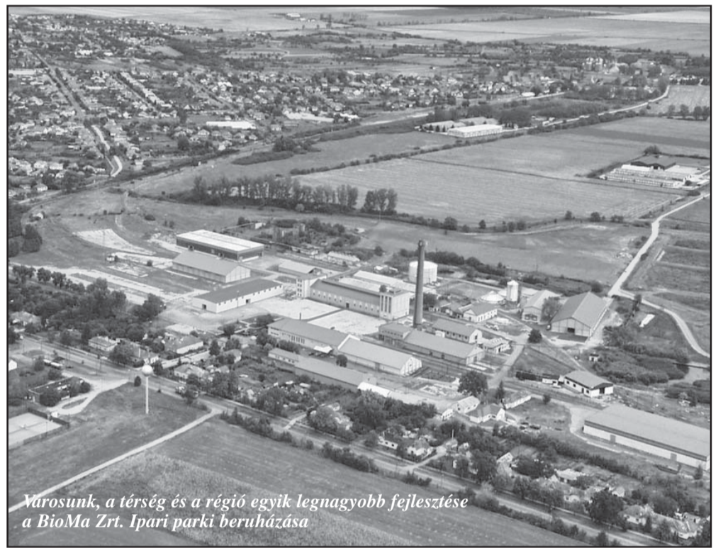
Városunk, a térség és a régió egyik legnagyobb fejlesztése a BioMa Zrt. Ipari parki beruházása