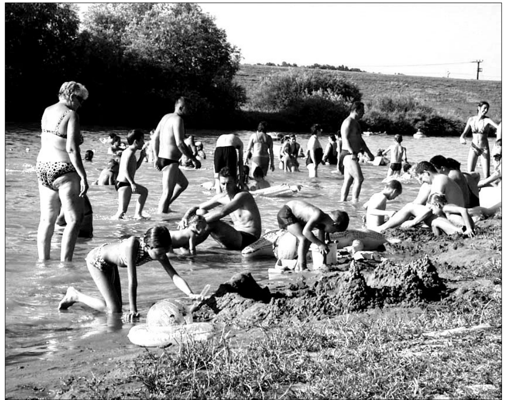
A legjobb amit tehetünk ezekben a napokban. (A Fekete-Körös városrdei szabadstrandja)

A hűvös, változékony napok után erőteljes hőhullám tör ránk a héten. A hét második felében 41 fok körüli forróság várható az előrejelzések szerint. Okozója egy afrikai eredetű forró légtömeg. Elrendelték - hazánkban először - a harmadik fokozatú hőségriadót. A harmadik fokozatot, a riadójelzést akkor adják ki, ha várhatóan legalább három egymást követő napon eléri a napi középhőmérséklet a 27 fokot, ami körülbelül 30 százalékos napi halálzárnövekedésnek felel meg. Ez már katasztrófavédelemnek minősül, és a katasztrófavédelmi törvény alapján - az országos, illetve regionális tisztviselő főorvos kezdeményezésére - a fővárosi vagy regionális védelmi bizottság dönt a rendkívüli intézkedések meghozataláról.