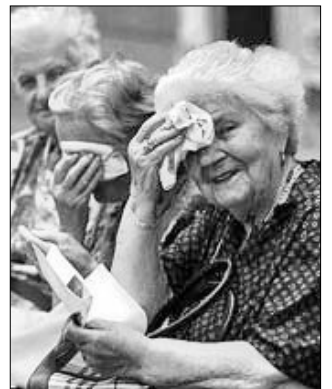
Elsősorban az idősek szervezetére hat kedvezőtlenül a tartós hőség