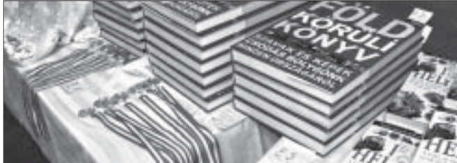
Értékes könyvek és érmek találtak gazdára

Az eredményhirdetés végére elfogyott a sok-sok ajándék, az izgott arcok egyre boldogabbak lettek, amihez hozzájárult az iskola énekkarának ez alkalomra írt vidám matekos dala is, mellyel ven-