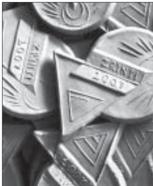
Ebből mindenki kapott