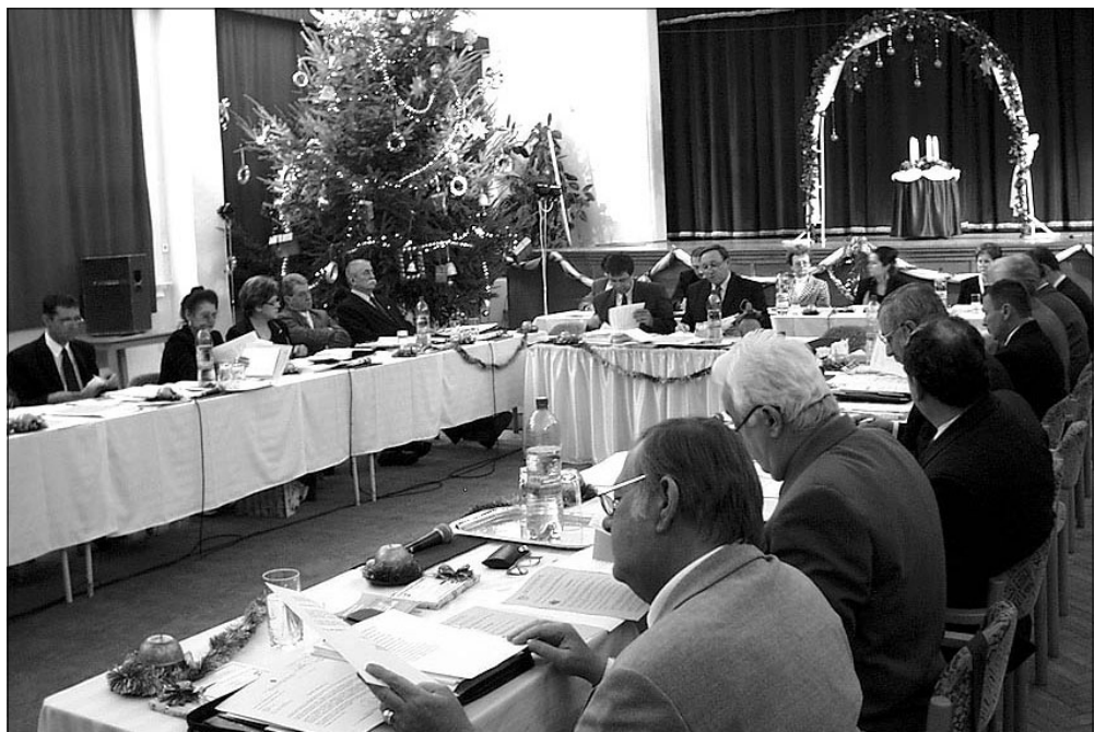
Az ünnepi műsor után a testület már a „szokásos hétköznapi mederben” folytatta a munkát a késő esti zárásig

Az elmúlt önkormányzati év zárásaként – mint minden évben – ünnepi testületi ülésre került sor karácsony előtt. Mint az elmúlt évben, úgy most is mielőtt a testület az érdemi munkához kezdett volna egy karácsonyhoz, az adventhez kapcsolódó ünnepi műsornak lehettek a részesei