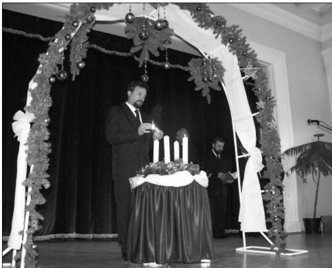
...majd meggyújtották az adventi koszorú gyertyáit

Ezzel a testületi ülés ünnepi része lezárult, következtek a munkával töltött órák, hiszen karácsony ide, karácsony oda a város dolgainak „menni kell”. Rendeletek al-