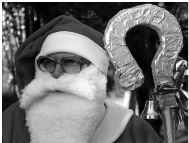
Útban a nehéz putnyú városi Télapó

2006. december 9.-én ismét ellátogatott a Télapó a város gyermekeihez, a Bartók Béla Művelődési Központba, az 1. Sz. Óvoda által rendezett Télapóünnepségen.