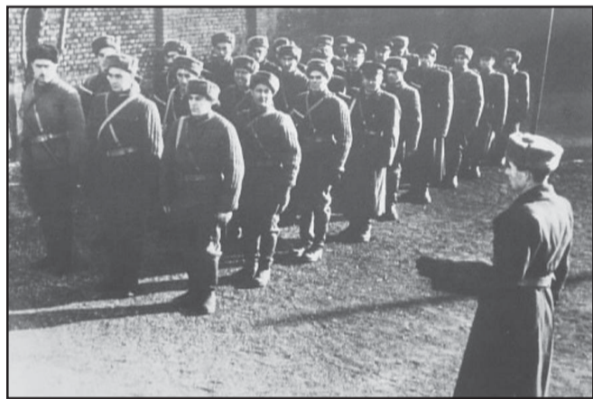
56' utáni tisztogatást végző fegyveres karhatalmisták a pufjakások