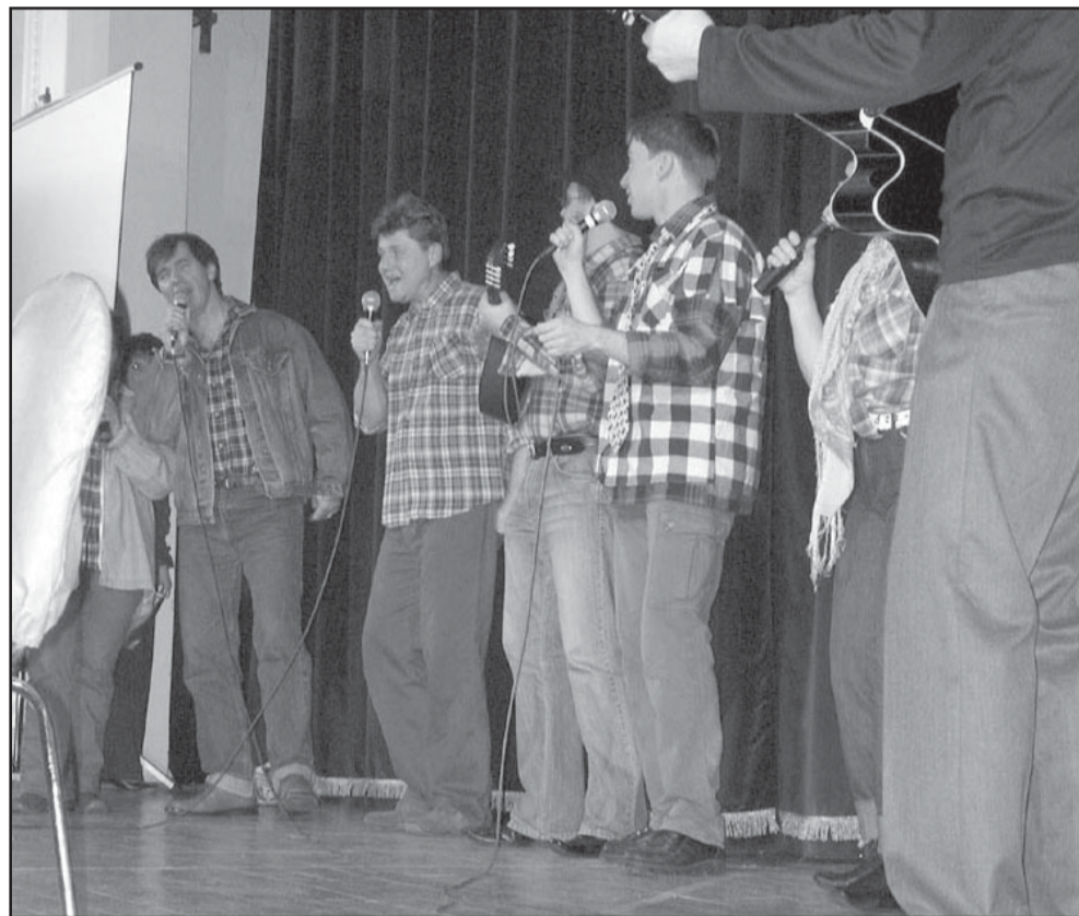
Tanárok a színpadon

2006. február 17-én harmadik alkalommal került megrendezésre iskolánk alapítványi estje, melyre igen szép számmal érkeztek vendégeink, kétszázán kísérték figyelemmel diákjaink és kollégáink műsorát.