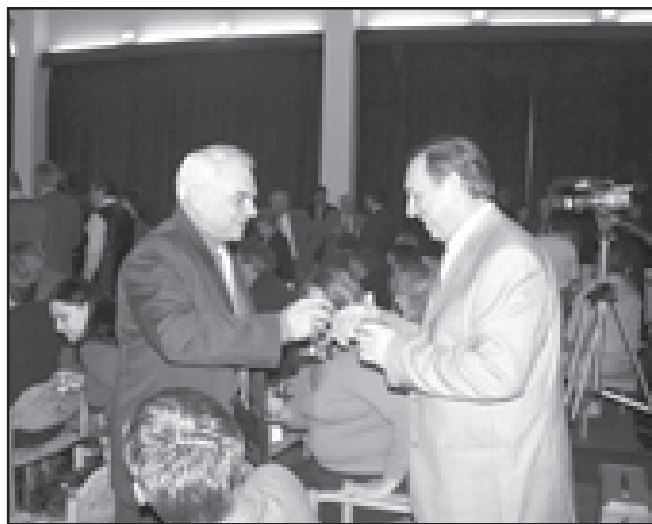
Mint ahogy máskorsem, most sem maradt el a személyes pohárköszöntő

A volt cukorgyári strand kimúlását követően szeretnénk, ha az itt felcseperedő fiatalságnak lehetősége nyíl-na a ma már elengedhetetlen vízi sportok megismerésére. Kistérségi szinten mintegy 4500 gyermekkel lehet szá-molni, ami, ha hozzá adjuk azon felnőttek számát is akik, a napi munka után kikapcsolódásként igénybe vennék, akár a duplája is lehet.