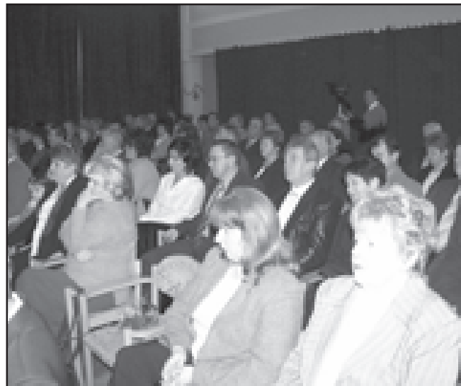
Sokan elfogadták a város meghívását