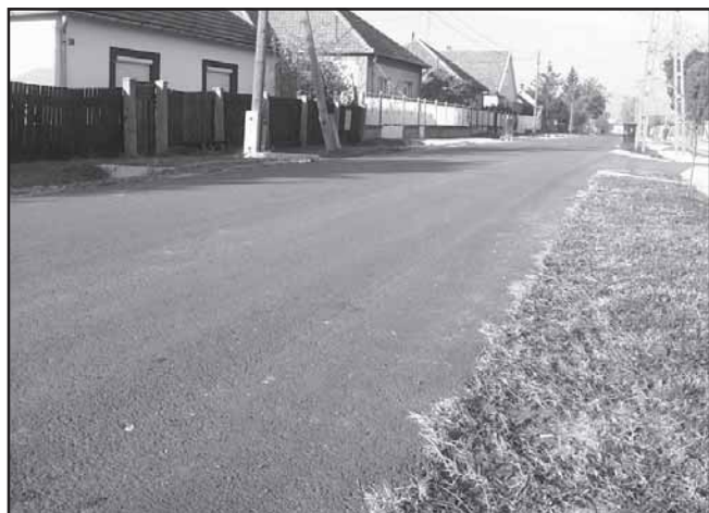
Összesen 34 millió forintba került az út megépítése.