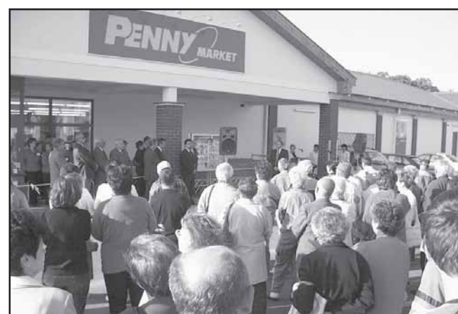
Az áruház épülete javítja a városképet

Nem önkormányzati beruházás, de az önkormányzat közreműködésével települt a Penny Áruházlánc Sarkadra is ebben az esztendőben. Évközben már számot adtunk a program előzményeiről és azóta már a vásárló közönség birtoká-