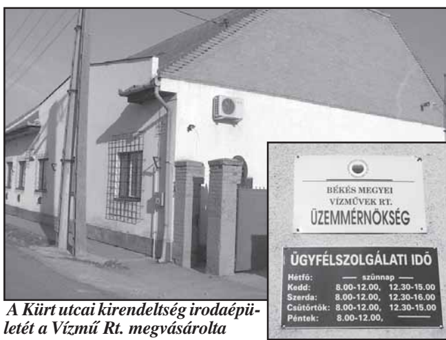
A Kürt utcai kirendeltség irodaépületét a Vízmű Rt. megvásárolta

Városunk egészséges ivóvízzel való ellátása minden lakos részére biztosított. A vezetékes ivóvizet, annak vezetékrendszerét, szivattyúit azonban karban kell tartani. Az új építkezéseknél a telkekhez a gerincvezetékkel el kell juttatni a vízvezetékét. Ilyen és hasonló feladatokat végez a Békés megyei Vízmű Rt. az általa ellátott településeken, így Sarkadon is. Hosszú évek óta indítványoztuk és kértük, hogy Sarkadon is legyen egy kirendeltség a város és a kistérsége lakóinak közvetlen elérhetősége érdekében. Mivel ilyen kirendeltség legközelebb Gyulán volt, különböző ügyintézésre a városunk és térsége lakóinak Gyulára kellett utaznia.