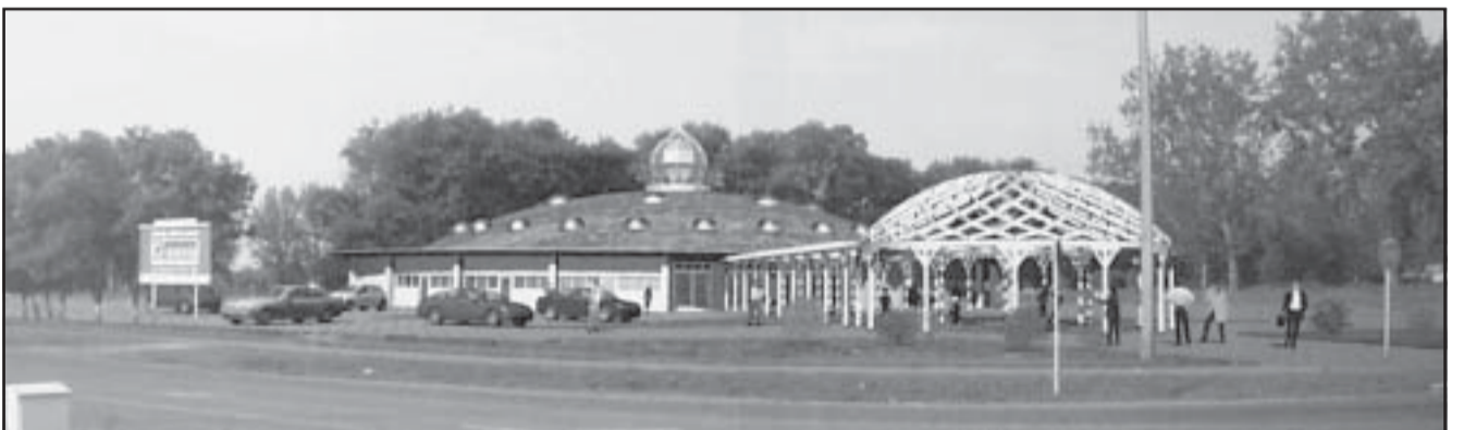
A fürdő külső látványterve, amely elnyerte a képviselő-testület támogatását