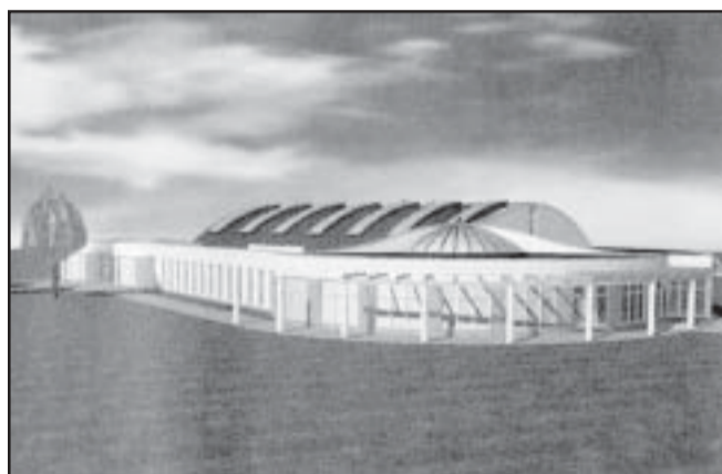
A második illetve a harmadik pályázat látványtervei