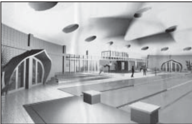
A terv első nagy egysége a fedett fürdő, tanmedence építése

mával mi nem örököltünk szépen elindított, virágzó fürdő fejlesztést, sőt a cukorgyári egyetlen medence is a '80-as években a gondos gazda hiányában romjaiba hullt.