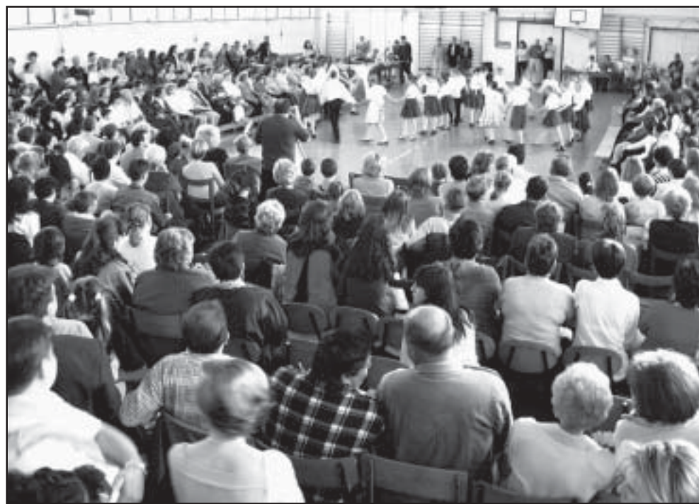
A jubileumi esten is – ahogy eddig mindig – zsúfolásig telt nézőkkel a tornacsarnok

Különleges nap volt április 26-a a 2. Sz. Ált. Iskola pedagógusai, gyermekei számára, hiszen 10. alkalommal rendeztek jótékonyági estet. Az iskola hatalmas tornacsarnoka olyannyira megtelt, hogy úgy tűnt: ott az egész város apraja-nagyja.