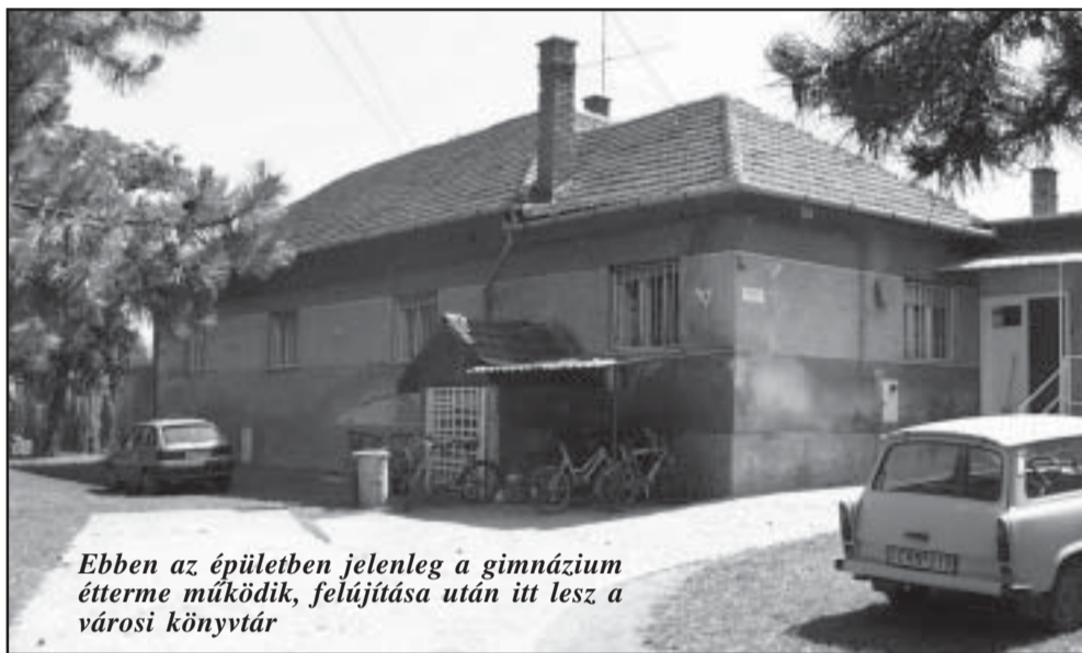
Ebben az épületben jelenleg a gimnázium étterme működik, felújítása után itt lesz a városi könyvtár