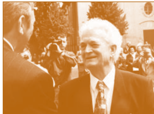
Sarkadon díszpolgárrá avatásakor