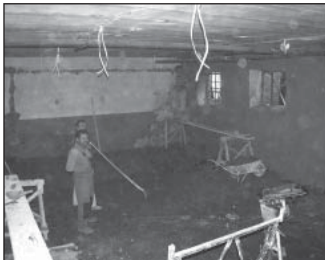
A gimnázium alagsorában már épül az új étterem

kezhettek a tanulók. A középiskola vezetésének, diákjainak is ez volt a régi álma, de mindezidáig nem teljesíthető igénye.