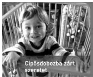
Cipősdobozba zárt szeretet

...és senki se a maga hasznát nézze, hanem mindenki a másokét is” Filippi 2, 4