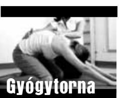
„Egészségünkünk III. rész”