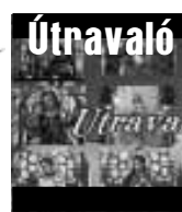
Katolikus gondolatok 41 percben

Jövő heti műsor: május 28-án (csütörtökön) 19.00 órai kezdettel, ismétlés 29-én (pénteken) 10.00 órakor