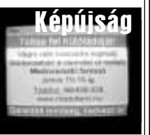
Képviség 24 órában