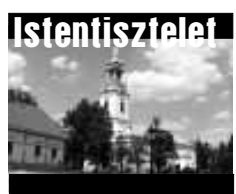
A belvárosi református templomban