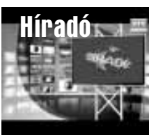
Friss közéleti hírek