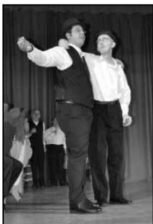
A vendéglátó sarkadiak vidám szüreti játékokat állítottak színpadra (a közönség vastapsal jutalmazta)