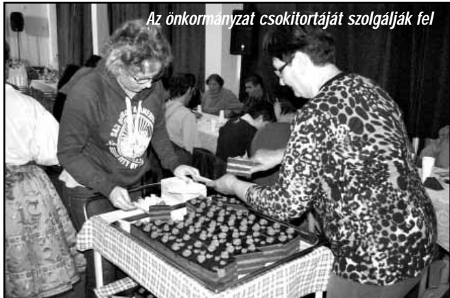
Az önkormányzat csokitortáját szolgálják fel