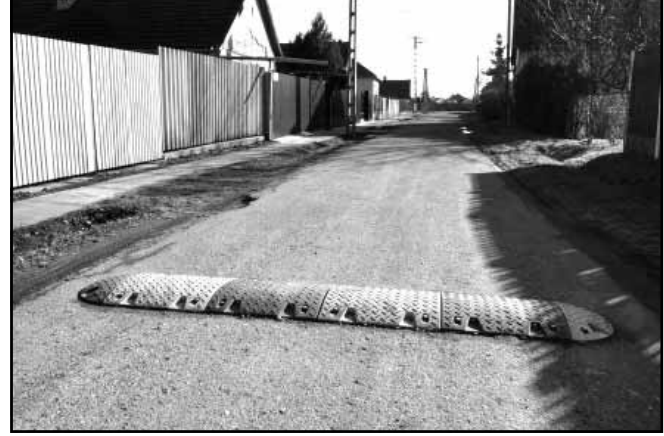
A Kút utcában „szolgálatba helyezett fekvőrendőr”