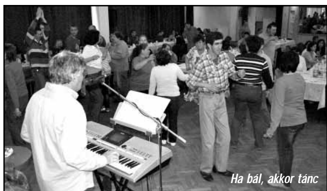
Ha bál, akkor tánc