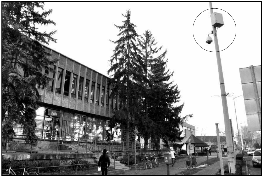
A korábbi három kamera közül az egyik az Árpád fejedelem téren, a posta előtt „dolgozik”

Az újabb kamerák egy Belügyminisztérium által kiírt pályázatnak köszönhetően jutnak el Sarkadra, mely pályázat már az elmúlt év tavaszán beadásra került, ám akkor azt nem támogatták. Viszont az új városvezetés érdekérvényesítő képességének köszönhetően a következő pályázati körben a Belügyminisztérium már támogatta a sarkadi projektet, s ennek köszönhetően 2014. december 19-én aláírásra kerülhetett Budapesten a támogatási szerződés. A Belügyminisztérium tá-