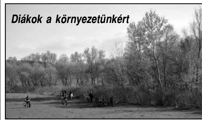
Diákok a környezetünkért