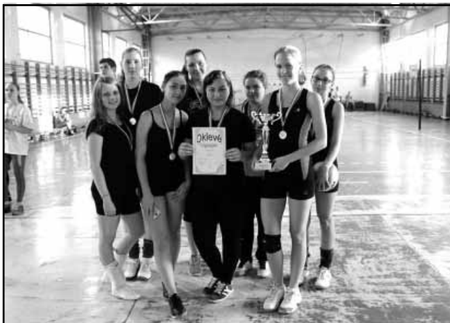
Az Ady-kupa győztes röplabdacsapata

A legnagyobb várakozás az osztályok bemutatkozó műsorát előzte meg. A legtöbb heteken át készültek az eseményre. Elsősorban vidámság, móka jellemezte a produkciókat. A zsűrinek nem volt nagyon könnyű a dolga. Végül az alábbi döntést hozta: 1. helyezett a 10.A, 2. helyezett a 11.A, 3. helye-