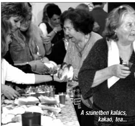
A szünetben kalács, kakaó, tea...