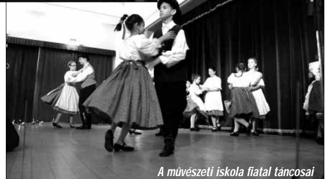
A művészeti iskola fiatal táncosai