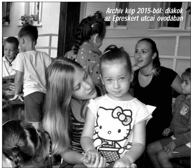
Archív kép 2015-ből: diákok az Egreskert utcai óvodában