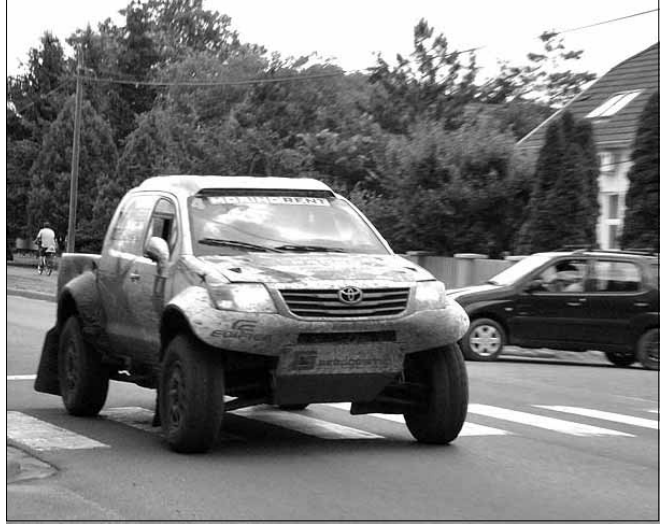
A legjobb magyar páros Toyota Hilux Overdriv-ja a sarkadi utcán

Még június elején rendezték meg a Nyílt Terep-rallye országos bajnokság harmadik futamaként, a Közép- európai Zóna Bajnokságban pedig a negyedik fordulóként a V. Gyulai Várfürdő Kupát. A versenyzők körében egyre népszerűbb Viharsarki verseny történetében talán a legnépesebb terepralis armada érkezett Gyulára.