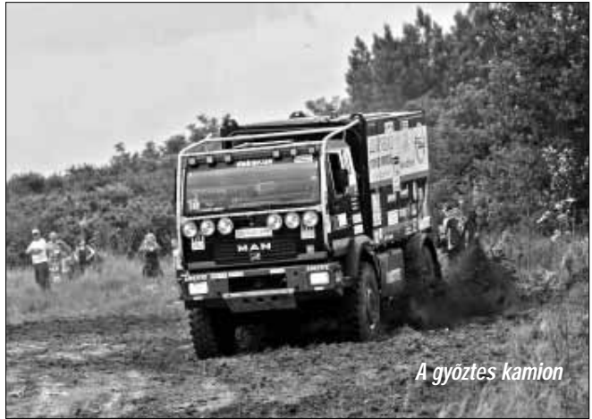
A győztes kamion

Nos, a verseny össz. hossza 635 km volt, amelyből a szelektív szakaszok 330 km-t tettek ki. Az idén Sarkad, Sarkadkeresztúr, Doboz, Tarhos és Kőtegyán külterületéhez tartozó földutak hálózata szerepelt a versenytérképen, ezért aztán két napon át izmos autómotorok hangjaitól volt zajos a határ. Mit a határ... a város is. A verseny előtt és után – úton a versenyzőkhöz – a város közútjait is igénybe vették a sportautók - igaz nem verseny tempóban.