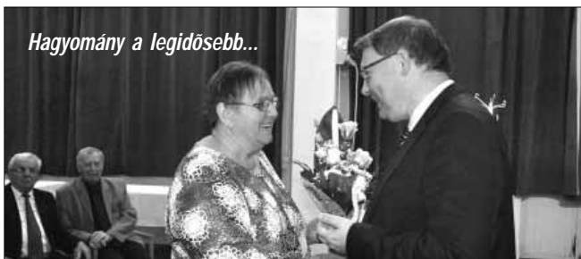
Hagyomány a legidősebb...