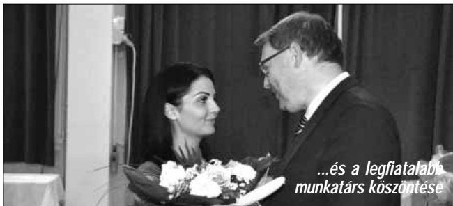
...és a legfiatalabb munkatárs köszöntése

Az ünnepség hivatalos részének zárásaként dr. Mokán István polgármester mondott pohárköszöntőt. A városvezető kihangsúlyozta, hogy a 2014-ben megválasztott új városvezetés egy szép hagyományt élesztett újjá, melynek keretében minden esztendőben köszöntik a városban, a városért tevékenykedő pedagógusokat, egészségügyi dolgozókat, köztisztviselőket, a közszolgáltató szektor dolgozóit és természetesen a Szociális Munka Napja apropóján a szociális szféra dolgozóit. A polgármester gondolataiba egy szép, Gárdonyi Gézáról származó idézetet is beleszólt, mely szerint „a tereben helyet foglaló dolgozók olyan lámpások, amelyek minél inkább világítanak másoknak,