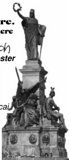
(Az aradi Szabadság szobor)