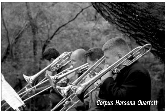
Corpus Harsona Quartett

A három napos rendezvény a családok valamennyi