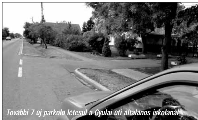
További 7 új parkoló létesül a Gyulai úti általános iskolánál