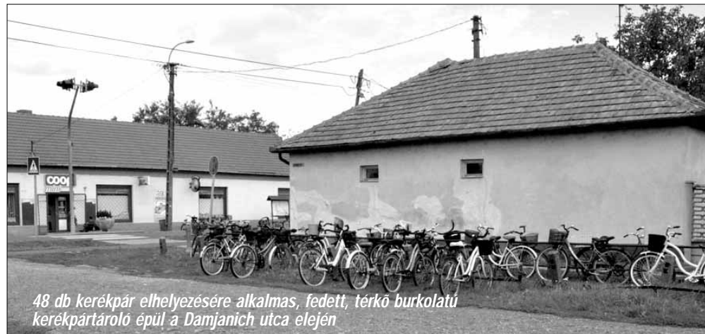
48 db kerékpár elhelyezésére alkalmas, fedett, térkő burkolatú kerékpártároló épül a Damjanich utca elején

2017-ben a fenti járdaépítési program mellett - az áprilisban választókerületenként megtartott lakossági fórumokon megfogalmazott kérések figyelembe vételével - a választókerületek fejlesztésére fordítható önkormányzati pénzalapból is számos utcában fejlesztjük a járdákat és természetesen kar-