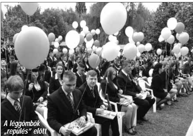
A léggömbök „repülés” előtt