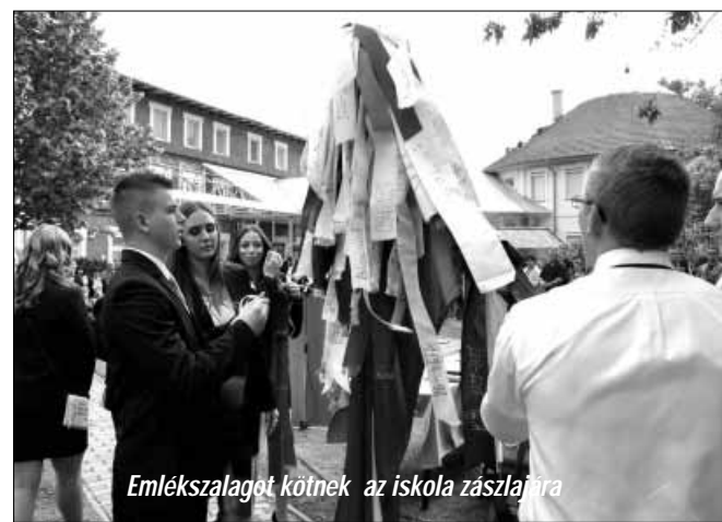
Emlékszalagot kötnek az iskola zászlajára