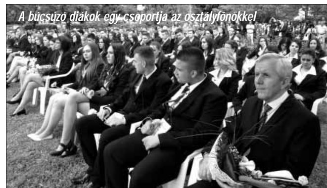
A búcsúzó diákok egy csoportja az osztályfőnökkel