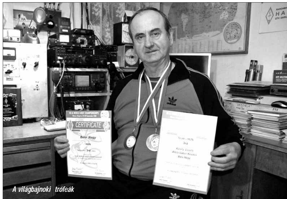
A világbajnoki tróféák