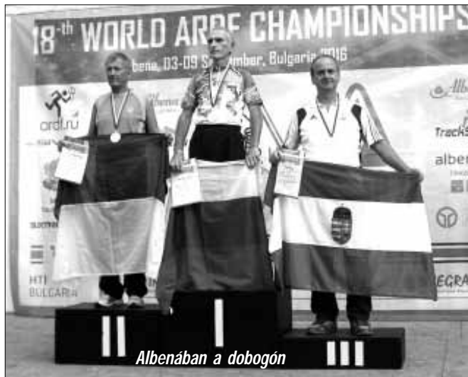
Albánában a dobogón