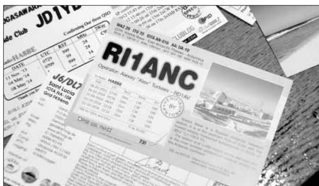
Egy rádiókapcsolat igazolólapja, amely a Déli-sarkon lévő Voszok orosz kutatóállomás munkatársával, Alekszej Turkejevvel jött létre