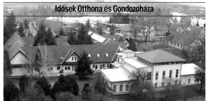
Idősek Otthona és Gondozóháza

A Gyulai u. 8. szám alatti Idősek Otthona és Gondozóháza akadálymentesített, parkosított, kellemes környezetben, családi légkörben, emelt szintű 2 ágyas, fürdőszobás szobákkal várja az idősek jelentkezését. Az otthon komplex, személyre szóló teljes körű ellátás, aktív pihenés keretében biztosítja lakói számára a kiegyensúlyozott életet.