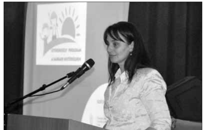
Langerné Victor Katalin helyettes államtitkár

A projektnyitó rendezvényre a szaktárca részéről Sarkadra látogatott és köszöntötte a jelenlévőket Langerné Victor Katalin társadalmi felzárkózásért felelős helyettes államtitkár. Az Emberi Erőforrások Minisztériumának helyettes államtitkára kihangsúlyozta, nagyon fontos, hogy a programba bevont gyermekek érezzék, érték van ez a program. A cél az, hogy az ő helyzetük javuljon és előttük is úgy kitaruljanak a lehetőségek, ahogy a jobb anyagi körülmények között élő gyermekek előtt. A Sarkadon és a sarkadi kistérségben elinduló program megteremt annak a lehetőségét, hogy a bevont gyermekek olyan környezetbe nőjenek fel, szocializálódjanak, hogy hasznos tagjaivá válhassanak hazánk társadalmának. A Sarkad környéki program nagy bizakodásra ad okot, ugyanis egy hasonló program már megvalósult a kistérségben. A jelenlegi projekt a korábbi folytatásának is tekinthető, az új programba számos korábbi tapasztalatot is beépítettek a hatékonyság érdekében. A helyettes államtitkár asszony szerint, ha mindez teljesül, az itt fel-