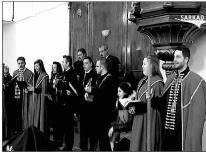
Teológus-lelkész és vallástanár szakirányos hallgatók küldöttsége

Az EFOP-1.3.7-17-2017-00318 kódszámú, Közösségfejlesztés Sarkadon a református egyház és helyi civil szervezete együttműködésével című projekt keretében 2018. március 24-én, szombaton a Sarkad-Belvárosi Egyházközség Gyülekezeti Termében részesei lehetünk Benedek Zalán: A harmadik napon című előadásának. Nem csupán nézők voltunk, hanem társak, akik végigkísérhették egy olyan árvaházba került, de nem valódi árva fiú életútját, aki megjárta a