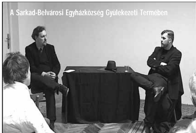
A Sarkad-Belvárosi Egyházközség Gyülekezeti Termében

KÖFOP-1.0.0-VEKOP-15-2016-00041, A szolgáltató kormányhivatali és közigazgatási modell bevezetése Részletes információk: www.bekesjarasok.hu