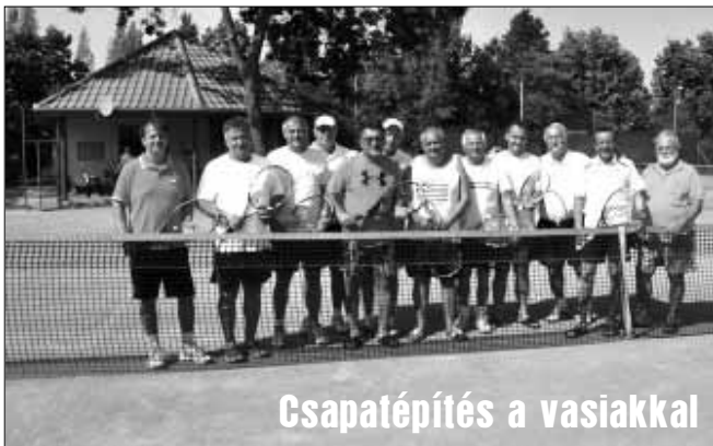
Csapatépítés a vasiakkal

A Sarkadi Kinizsi teniszesei csapatépítő jelleggel, minden nyáron közösen töltenek pár napot Balatongyörökön, ahol természetesen a sport sem szorul háttérbe. Így kerülhettek kapcsolatba a Szombathelyi Szabadidős TE néhány tagjával, akiket egy barátságos felkészülési mérkőzésre invitáltak a Viharsarokba.