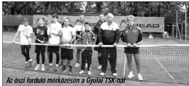
Az őszi forduló mérkőzésén a Gyulai TSK-nál

A csapat szereplését mérsékelt sikerek kísérték, ami azt jelenti, hogy a mérkőzések felét sikerült megnyerniük. A tavaszi és őszi fordulók összesítése után Sarkad a középmezőnyben végzett.