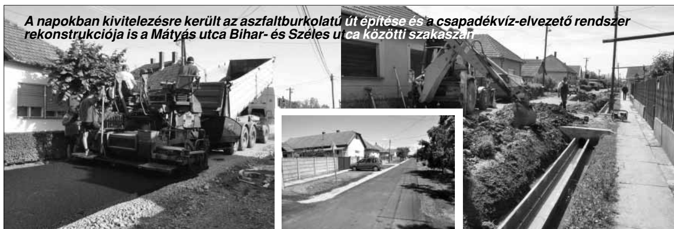
A napokban kivitelezésre került az aszfaltburkolatú út építése és a csapadékvíz-elvezető rendszer rekonstrukciója is a Mátyás utca Bihar- és Széles utca közötti szakaszán