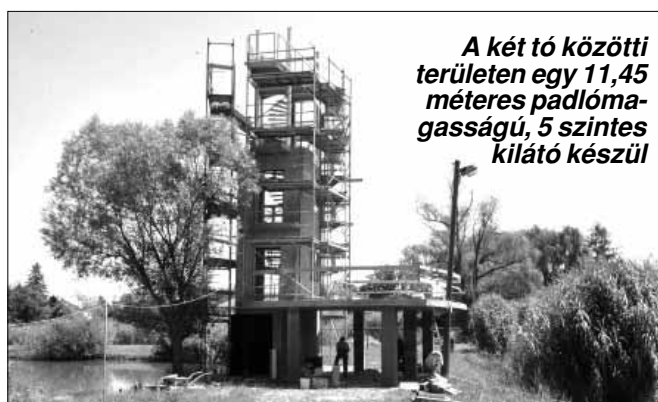
A két tó közötti területen egy 11,45 méteres padlómagasságú, 5 szintes kilátó készül