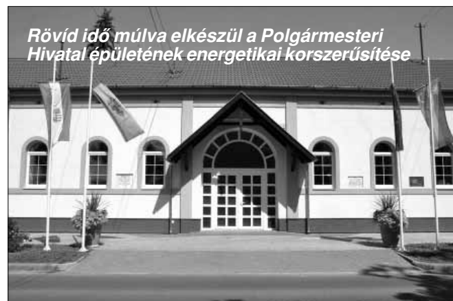
Rövid idő múlva elkészül a Polgármesteri Hivatal épületének energetikai korszerűsítése