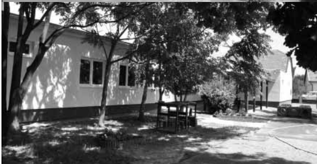
Jól halad az Epreskert utcai és a Vasút utcai óvodák épületeinek energetikai korszerűsítése is