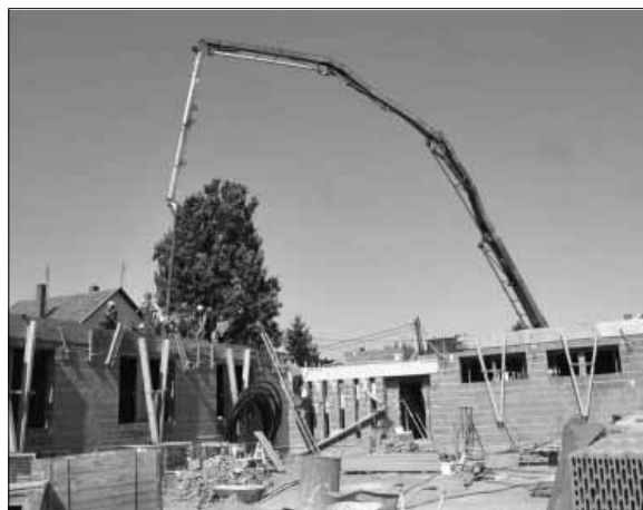
A Megyei Kormányhivatal beruházásában bővül a Sarkadi Járási Hivatal épülete