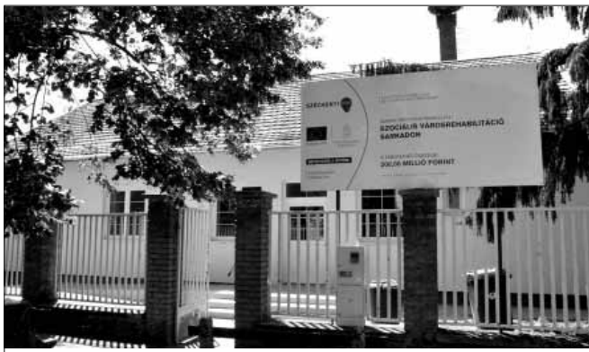
Rövidesen befejeződik a közösségi ház kialakítása a volt Tüdőgondozó épületében