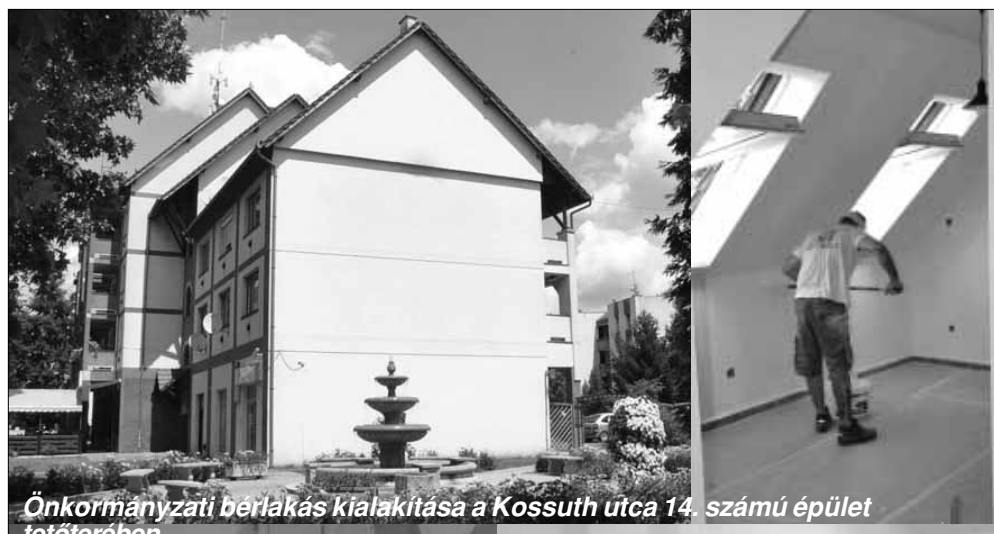
Önkormányzati bérlakás kialakítása a Kossuth utca 14. számú épület tetőterében

A szociális város rehabilitációs program keretében folyamatban van négy önkormányzati bérlakás kialakítása a Kossuth utca 14. és az Árpád fejedelem tér 5. szám alatti épületek tetőterében, illetve a Nagymező utca 33. szám alatti ingatlanban. El-