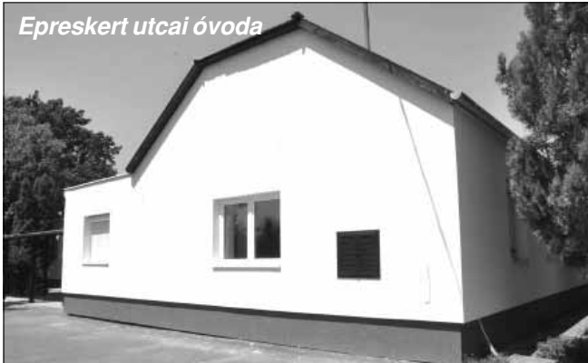
Epreskert utcai óvoda