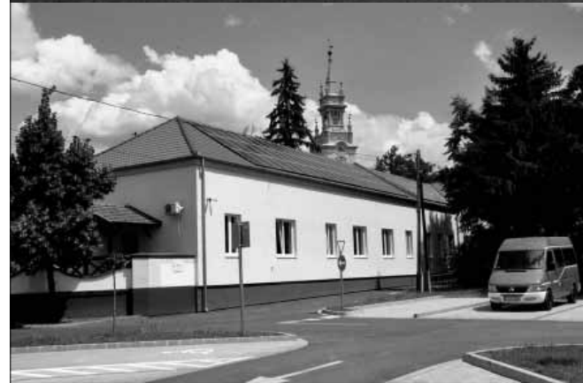
Hamarosan befejeződik a 60 férőhelyes új bölcsőde építése