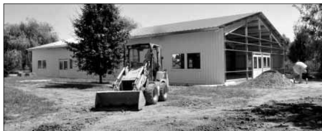
Az Éden tavaknál található szigeten egy 15x30 méter alapterületű fedett közösségi tér, csarnok épül