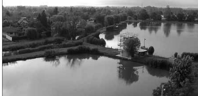
Ebben az esztendőben kezdődik a Tanuszoda építése