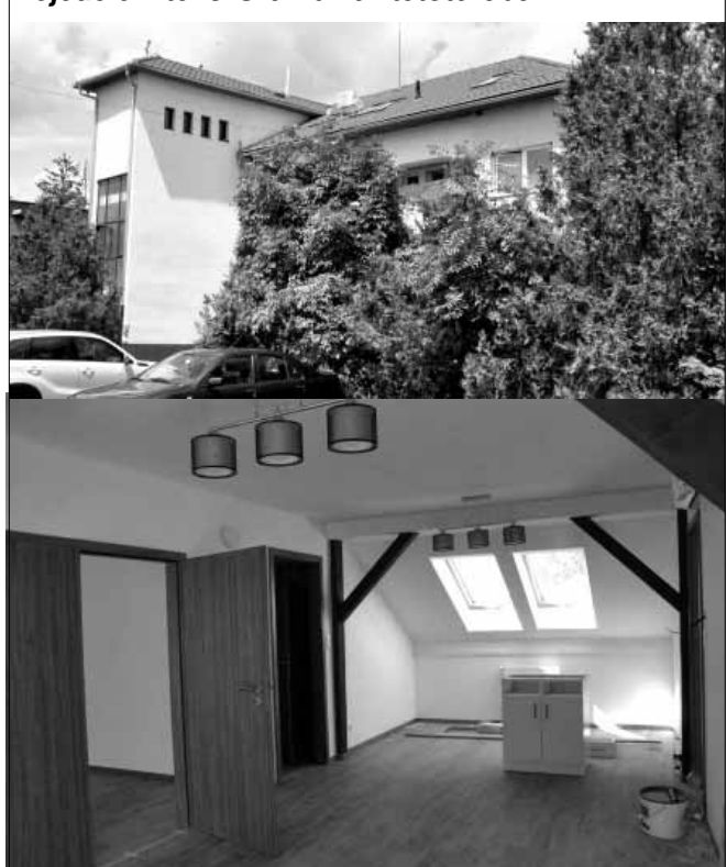
Önkormányzati bérlakás kialakítása az Árpád fejedelem tér 5. számú ház tetőterében

A Zöld város kialakítása elnevezésű programból megvalósul a Szent István tér parkosítása és csapadékvíz-elvezető rendszerének megújítása, a Gyulai út és a