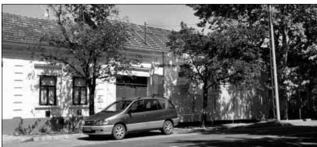
Szintén kezdetét vette a Városi Képtár és Kónya Emlékszoba Kossuth utcai épületének komplex megújítása