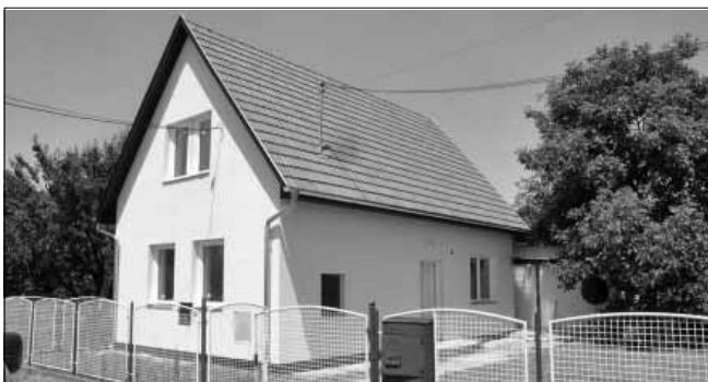
Önkormányzati bérlakás a Nagymező utca 33. szám alatt