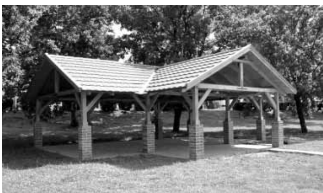
Az Éden-tónál 65 m 2 alapterületű – fa tartószerkezetű – filagória épült